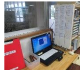
タイムカードによる 出退勤管理