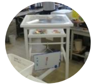
職員室の環境改善 による協働意識の 醸成