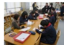
放課後の学習支援

重点モデル地域では、事務職員が中心となって、外部人材の派遣に関する業務を行っています。